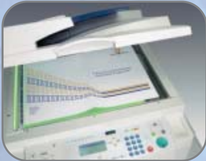
Letture dei documenti in formato A3 e ristampa degli stessi su formato A4